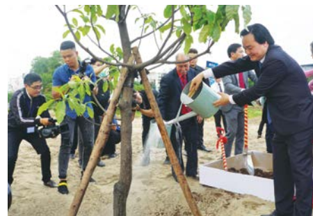
GS. TS. Vương Đình Huệ - Ủy viên Bộ Chính trị, Phó Thủ tướng Chính phủ và GS. TS. Phùng Xuân Nhạ - Bộ trưởng Bộ GD & ĐT tham dự Lễ Khởi công xây dựng Cơ sở 3 Trường ĐH Văn Lang - Q. Gò Vấp (Tp. HCM, 24/2/2017)