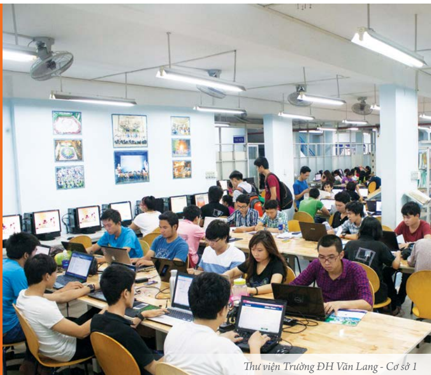
Thư viện Trường ĐH Văn Lang - Cơ sở 1