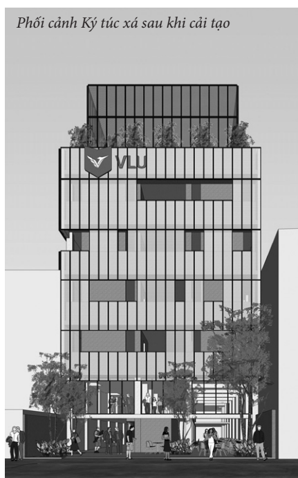
Phối cảnh Ký túc xá sau khi cải tạo

Ký túc xá Trường Đại học chính thức hoạt động từ năm học 2009-2010, có 6 tầng, 82 phòng, 600 chỗ ở với diện tích sàn xây dựng 2.417m 2 . Ký túc xá đảm bảo nhu cầu sinh hoạt và học tập của sinh viên, mở cửa từ 5 giờ đến 23 giờ hàng ngày; quy định không tiếp khách và không nấu ăn trong phòng (để đảm bảo an ninh và phòng ngừa cháy nổ).