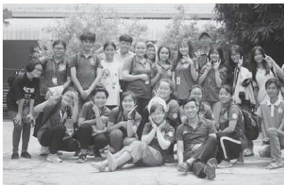
Sinh viên Văn Lang tích cực tham gia các hoạt động phong trào, hoạt động tình nguyện.