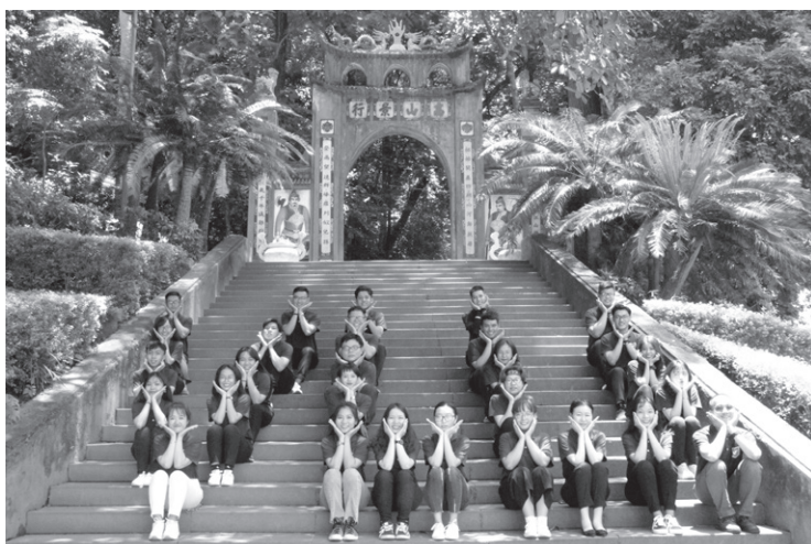
Đoàn Sinh viên tiêu biểu đại diện tham quan, học tập tại Đền Hùng năm 2019